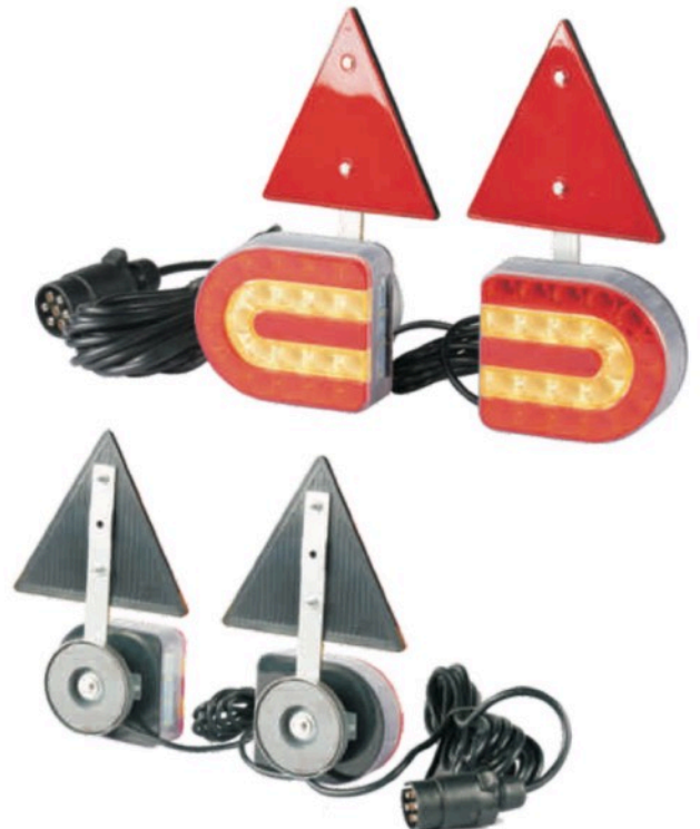
ESL54913 - s trikotnim odsojnikom