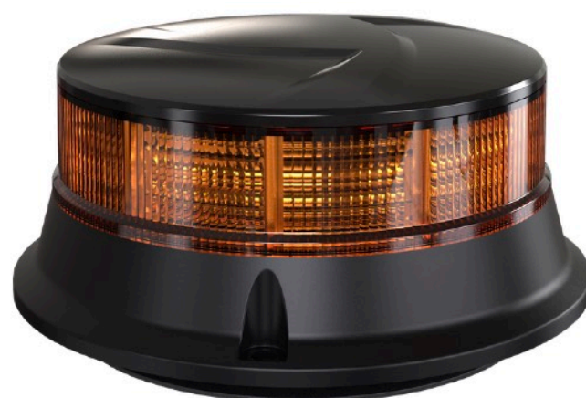
4 modalità di rotazione